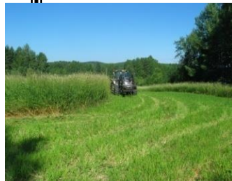
Liete ja ravinteet