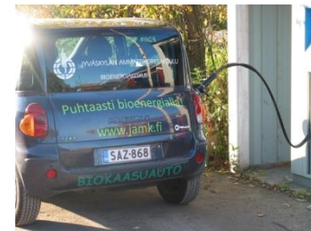
Biokaasun puhdistus ja paineistus