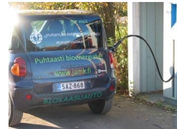
Biokaasun puhdistus ja paineistus