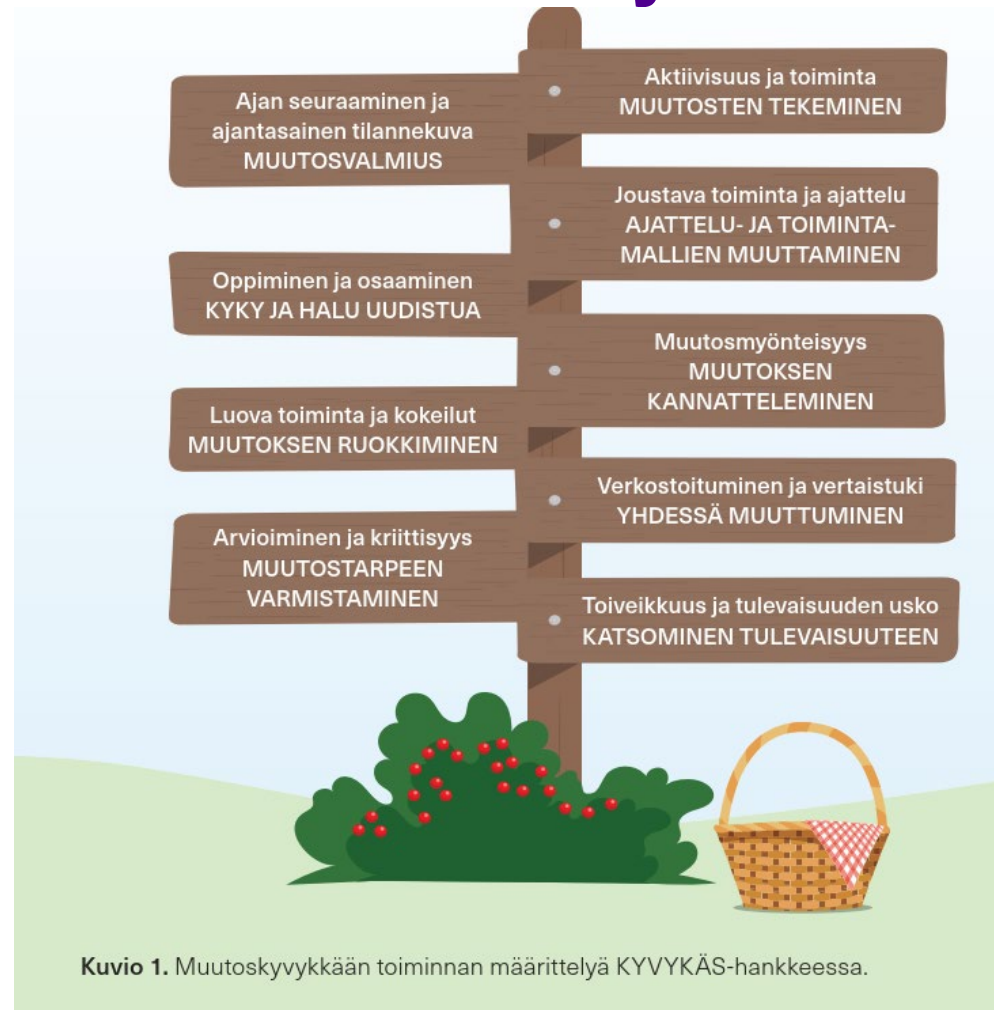
Kuvio 1. Muutoskyvykkään toiminnan määrittelyä KYVYKÄS-hankkeessa.