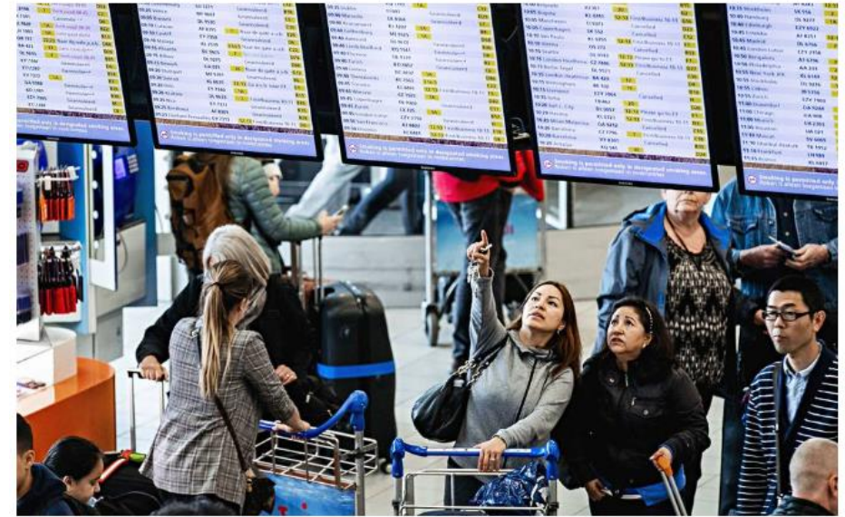
Kohti palvelua. Schipholin lentokentän valaistus toimitetaan jo palveluna. Seuraavaksi lentokentällä aiotaan siirtää näyttötalut palvelun piiriin.