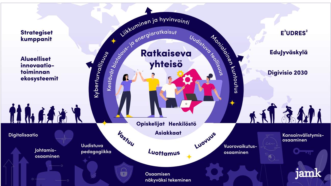
Kuva: Ratkaiseva yhteisö, visiona Uuden sukupolven korkeakoulu

Jamkin tekniikan alan tutkintokoulutus on vetovoimaltaan kansallista kärkeä. Globaalia osaamisen tasoa turvataan EUR-ACE akkreditoituilla tutkinto-ohjelmilla.