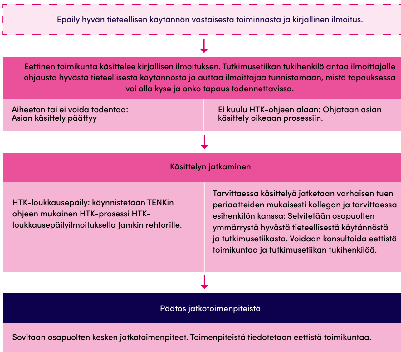
Kuvio 4. Menettelyohje henkilöstön vilppi- tai piittaamattomuusepäilyn käsittelyyn.