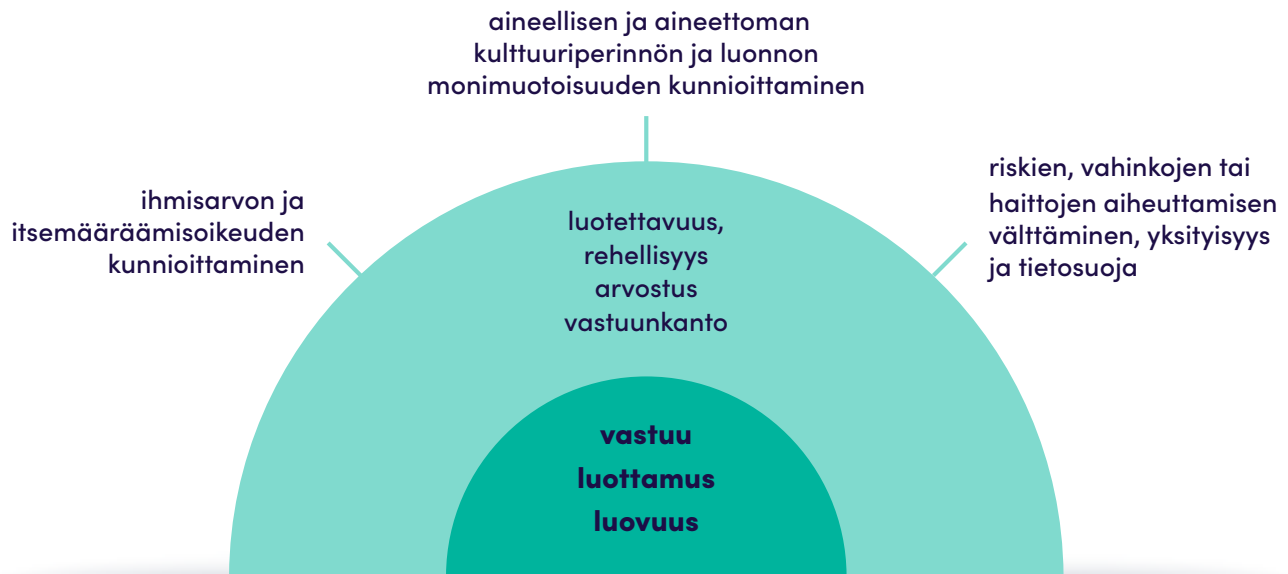
Kuvio 1. Jamkin toimintaa ohjaavat arvot ja eettiset periaatteet (Jamkin strategia, TENK 2019, 2023)

Jamkin arvot, hyvän tieteellisen käytännön peruseriaatteet vastuullisuus, luotettavuus, rehellisyys ja arvostus sekä ihmiseen kohdistuvan tutkimuksen yleiset eettiset periaatteet (TENK 2019) luovat arvoperustaisen toimintaympäristön vastuulliselle ja eettisesti kestäväälle toiminnalle korkeakoulussa (Kuvio 1). Yhteisiä arvoja ja periaatteita täydentävät ammattialakohtaiset eettiset ohjeet sekä henkilötietojen käsittelyä ja yksilön suojaa koskevat tietosuojasäännökset. Hyvän tieteellisen käytännön peruseriaatteet mukailevat myös eurooppalaista tutkimusetiikan ohjeistusta (ALLEA – All European Academies).